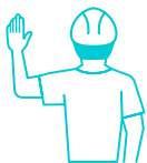
Right Turn (右折)